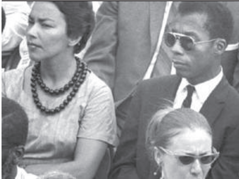
I'm not your negro