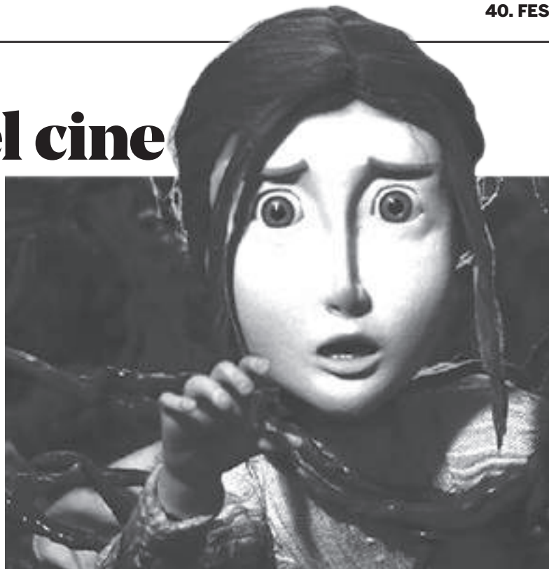
Almofada de penas.

Segundo clip mexicano realizado bajo la técnica de stop motion , Viva el rey es la propuesta que trae el director de animados Luis Téllez Ibarra. Un clip de casi ocho minutos en el que se enfrentan dos bandos imaginarios en una partida de ajedrez. La clase más