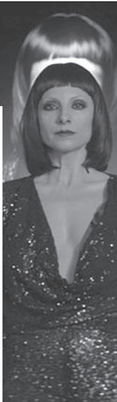
Quién te cantará.

Al cabo de dos años de recibir en el festival donostiarra el premio al mejor guion por Que Dios nos perdone , el director Rodrigo Sorogoyen retorna en clave de Thriller político con El reino –exhibida en la sección Contemporary World Cinema en Toronto–. El centro es un influente vicesecretario autonómico que, de pronto, se ve atrapado en una auténtica telaraña de corrupción de la cual es imposible escapar ileso. «El thriller era la forma que queríamos dar a la historia, pero el interés estaba en intentar acercarnos a